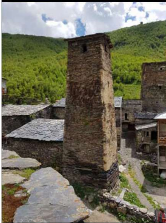
• Местия • Жилищна кула в селцето Ушгули