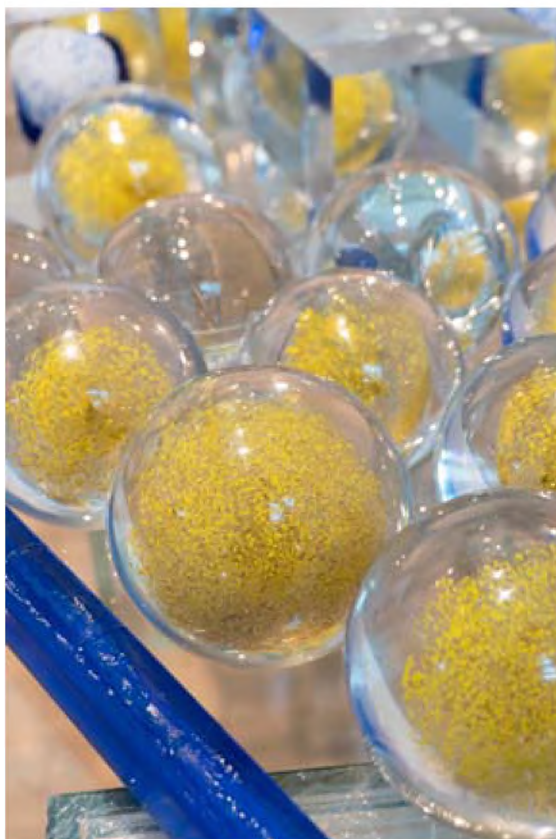
Константин Вълчев Движение , 2019 вариращи размери стъкло