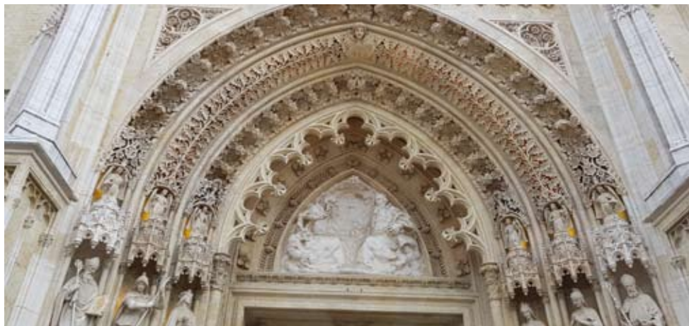
• Част от украсата над входа на катедралата в Загреб

Епископ Йосип Щросмайер е радетел за обединение на Православната и Католическата църква, поради това трудно приема решението за непогрешимостта на папата на Първия ватикански събор, в който участва активно. Счита, че това ще бъде пречка пред обединението на двете църкви. Последен от епископите на Хабсбургската империя подписва решенията на събора, това му коства и кардиналската шапка. Епископът се застъпва в духовните училища на Далмация да се въведе изучаването на глаголица.