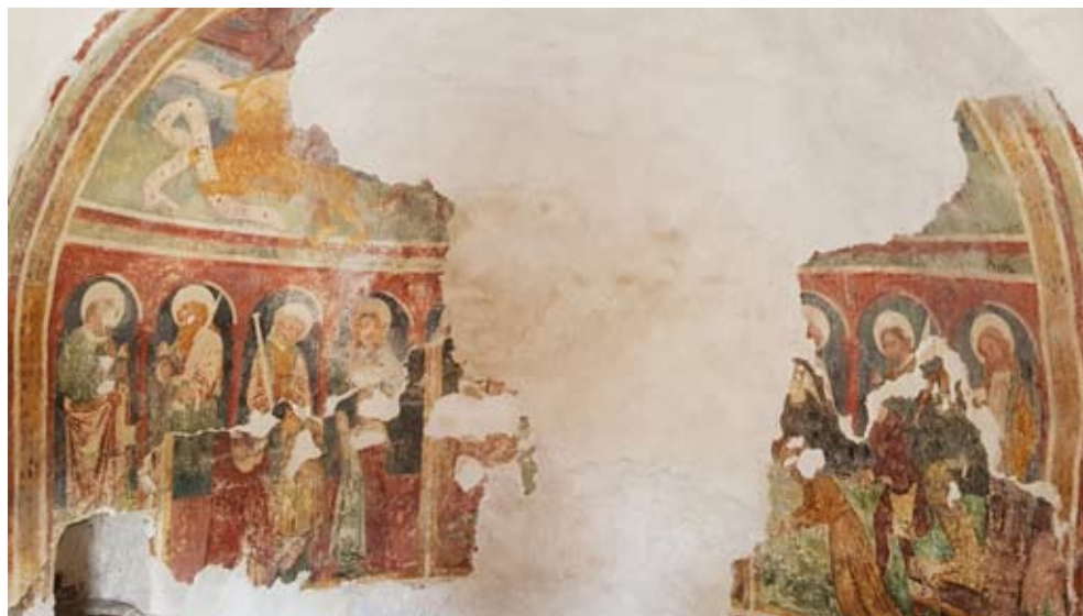
Апсидата на храма „Св. Рок“ в Роч

Преди няколко години попаднах на информация, че група младежи, сред които и студенти от НБУ, са решили да изминат с велосипеди Диагоналния път, свързващ Централна и Западна Европа с Константинопол. Въпреки изгубения тренинг в спортуването с велосипед (от години ходя пеша, за да се подготвям за Камино де Сантяго) извадих карти, лекции, книги и пътеводители, за да видя дали ще мога да се справя. Изучавайки внимателно терена и местата, през които трябва да се мине, установих, че съм посетил, при това по няколко пъти, по-голямата част от Виа Диагоналис , при това най-важните места, които са на територията на Турция, България и Сърбия.