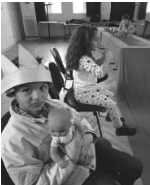
Снимка 1. Дете избира за свой персонаж кукла*

От нещо древно и далечно за децата, историята на Медея се превръща в нещо тяхно. Без да искат, разбирайки историята, те започват да разбират и себе си чрез нея.