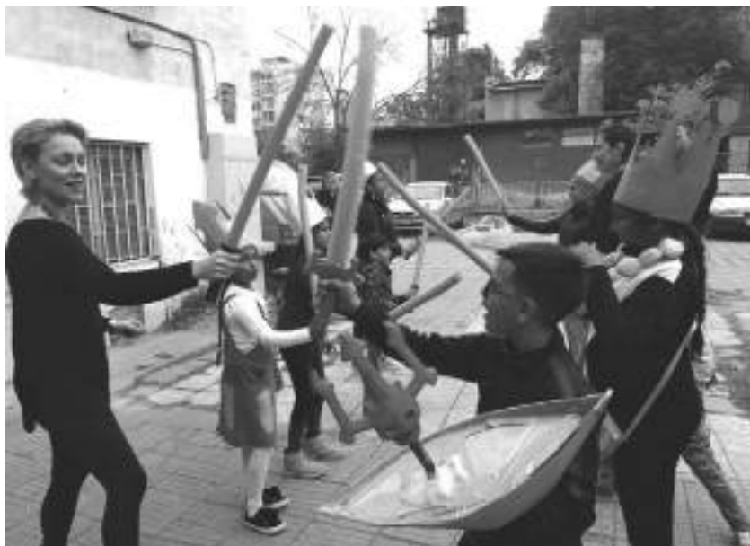
Снимка 3. Репетиция за спектакъл „Медея“ – Столипиново, април 2019