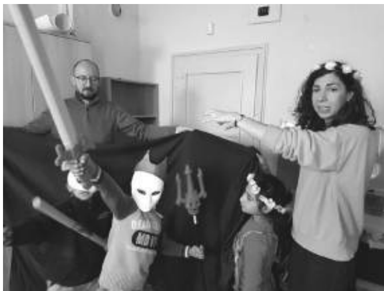
Снимка 2. Социодраматична работилница, Филиповци, февруари 2019.

Процесът на интеракция, който тръгва от разиграването на античния мит с децата – участници, завършва със завръщането му в театралния артефакт под формата на музикална фонограма. Сценарият, който използва екипа при воденето на обученията по мита на Златното руно във Филиповци и Факултета, е пренесен в спектакъла и се превръща в негова въвеждаща част – предиграта, която води Педагога /персонаж от драмата на Еврипид / и в която се изяснява цялата предистория на Язон и Медея.