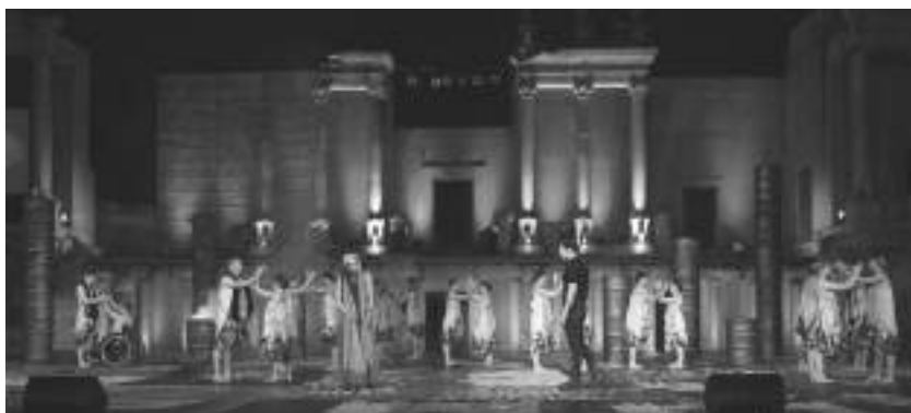
Снимка 14. Спектакъл „Меддея“. Сцена: комбинация с пляскане в изпълнение на античния хор в Първа сцена на Меддея и Язон, Античен театър, 28.06.2019.

Всички планирани обучения за деца се оказват не просто подготвителен и периферен етап за включването им в спектакъла, а негов същностен градивен материал. Екипът на проекта „Меддея“