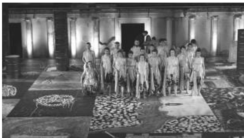
Снимка 9. Кадър от спектакъла с рисунката на Красимир Асърджиев