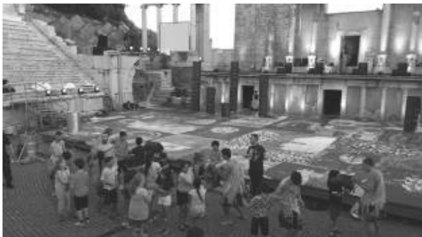
Снимка 13. Генерална репетиция на „Меддея“. Сцена: комбинация с пляскане в предиграта с участието на деца, Античен театър, 27.06.2019.