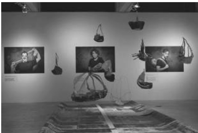
Снимка 7. Изложба „Терен Медея“, СГХГ, април 2019.