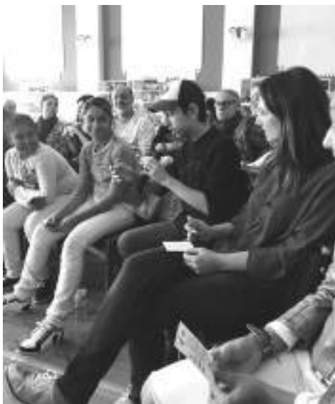
Снимка 15. Образователен концерт „Що е то античен театър – въпроси и отговори за деца“, октомври 2018, зала Шалом, Пловдив