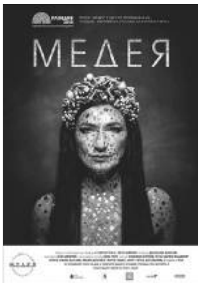
Снимка 20. Визия на плаката на спектакъла „Медея“

В настоящия доклад са представени само три фотографии от целия снимков материал събран по време на Selfie point. Предвид етичните норми и ограничения не е възможно да бъдат поместени съответните снимки без съгласието на участниците в тях. Всяка подобна фотография за екипа обаче е знак за приобщаване на публиката към проекта и за подкрепа на каузата за етническа толерантност, която стои в основата и на мотото на Пловдив ЕСК 2019 – „ЗАЕДНО“.