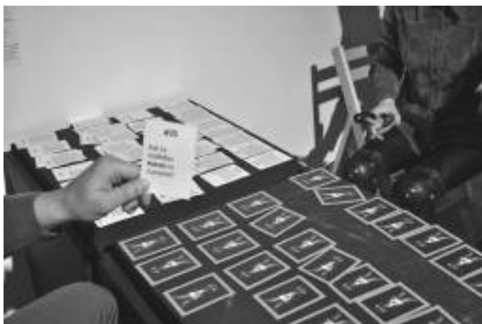
Снимка 16. Игрална маса, изложба „Терен Медея“