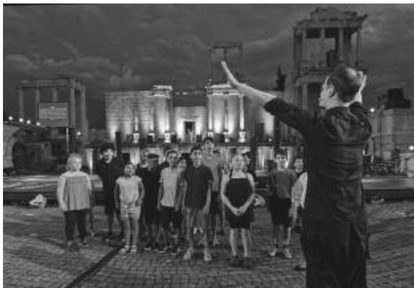
Снимка 5. Спектакъл „Медея“, 28 юни 2019, Античен театър, Пловдив Педагогът и децата