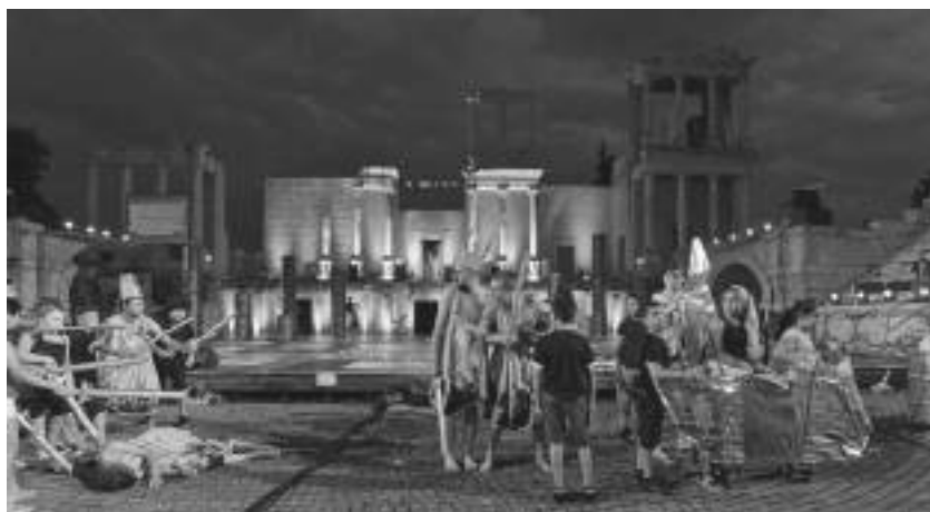
Снимка 4. Спектакъл „Медея“, 28 юни 2019, Античен театър, Пловдив Отборът на Колхис/Медея и на Йолкос/Язон разиграват мита за Златното руно