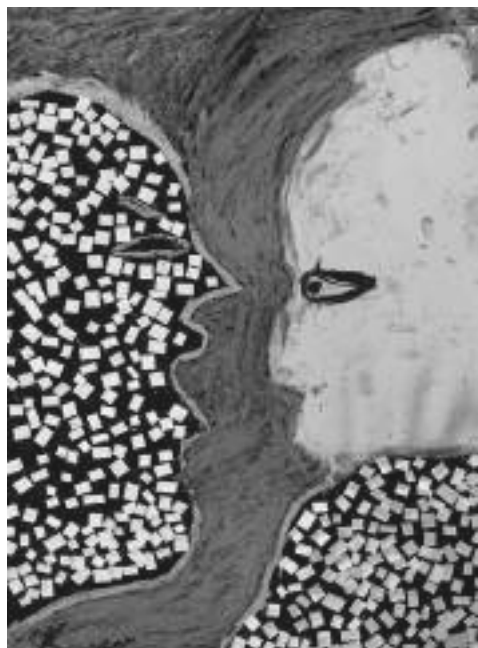
Снимка 8. Рисунка на Красимир Асърджиев, 9 г.