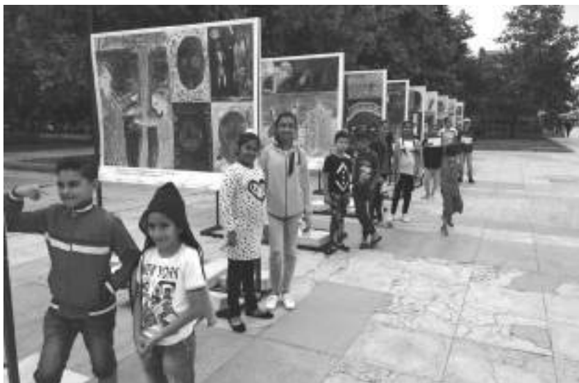
Снимка 6. Изложба „Децата на Медея“, постаменти на открито, площад Централен, Пловдив, юни 2018.