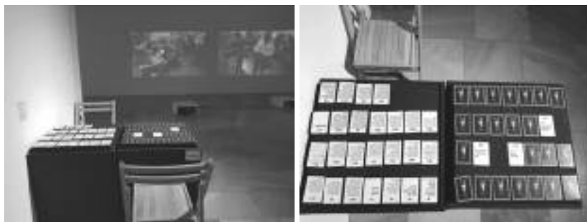
Снимки 17 и 18. Игрална маса, изложба „Терен Медея“

Разпоредителите са помолени специално да разяснят на посетителите, че пипането на предмети от изложбата е позволено. На масата седат посетители от различни възрасти, майки с деца, и се опитваха да играят. Много често посетителите си взимат тайно картичка от играта за спомен и така накрая въпросите и отговорите остават по-малко от 28.