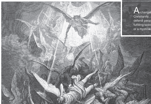
Изображение № 3. Части от обложката на двойния CD „Архангелите“

A rchangels impress the adherents of some of the world religions such as Christianity, Judaism and Islam. They are messengers of God and protect and defend people, challenge and punish them. They perform the will of God by fulfilling tasks set by Him. Every reference to them in the Bible is either a miracle or a mystical account relating to God.