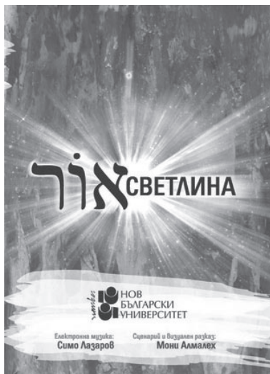
Изображение № 1. Обложка на DVD „Светлина“