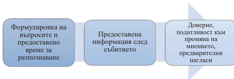
Фиг. 2. Фактори, оказващи влияние върху преценката на разпознаващия 21

Дезинформацията може да бъде получена чрез разговор с други очевидци или чрез внушаващи въпроси по време на разпит, който предхожда процеса на разпознаване. Въпросите, насочени към свидетелите, могат да включват невярна за очевидеца информация. Те могат също така да улеснят създаването на фалшиви спомени, без да предоставят някакво ново съдържание, например като приемат, че очевидецът задължително е наблюдавал дадено събитие. Разпитът обаче не само може да предизвика фалшиви спомени, но може да предизвика и забравяне на реално създадените такива. Практиката за извличане на информация при разпознаването обикновено подобрява припомнянето на изследваните предмети, но може да има и противоположни ефекти върху свързаната, но не и рекапитулирана информация. Това явление може да бъде наблюдавано по отношение на паметта на извършителя на престъплението. Множество фактори могат да окажат влияние върху паметта на лицата, извършващи разпознаване, част от които са представени на следващата фигура 2.